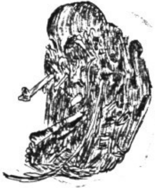
egagròpila d'una òliba que havia menjat un gorrió ( tamany natural )

El vol és silenciós per poder sorprendre les preses. Per aconseguir aquest silenci, totes les plomes de l'au que freguen l'aire al vol, acaben a les voreres amb una espècie de plomissó, i així el roçament no fa renou i no les delata.