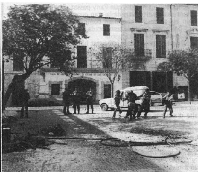
Canvi dels arbres de Sa Plaça. Canvi d'imatge

A principis del mes de març es procedí a canviar els vuit arbres de la Plaça d'Espanya per una nova varietat de plantació, coneguda vulgarment com a "Arbre de l'Amor"