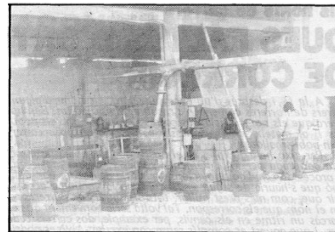
"Ara em venen a cercar per desfer botes grosses de celler".

M.B.- Malament, malament. Les botes es veuen substituïdes per bidons de plàstic i això fa que aquest ofici de boter estigui a punt de desaparèixer. Apre-