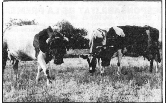
La rendabilitat en l'elaboració del formatge i altre derivats de la llet, sortida de futur?

DE LA PALLA: Degut a la poca aigua caiguda n'hi haurà