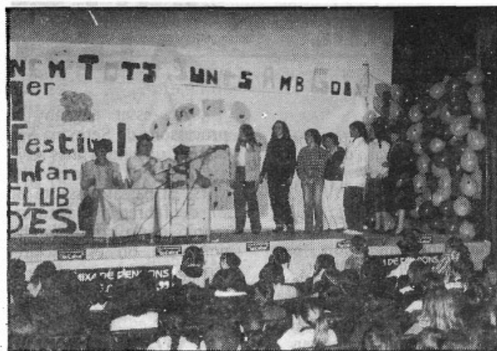
"No ens conformam amb entretenir i divertir als al.lots". 1er. Festival Infantil Foto Vidal

Una excursió al Puig de Santa Magdalena.