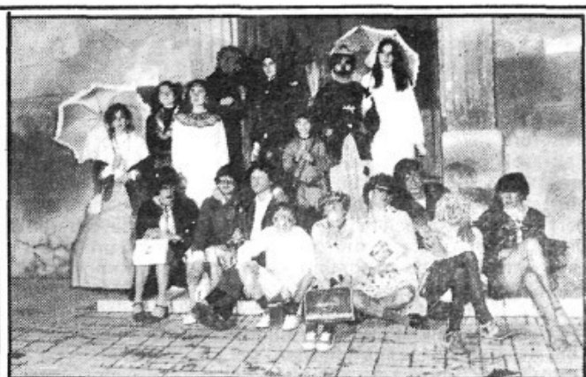
Cada any augmenten les disfresses i les festes per Carnes- toletes. El públic demana sarau...

La premsa mallorquina té un paper en aquesta tasca co- muna i si per negligència, convardia o mala fe l'abandona, con- traurà una greu responsabilitat davant el poble, que, si és cert que la veritat sempre sura, a la llarga, la hi haurà d'exigir.