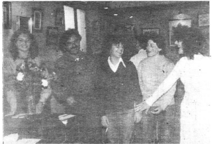
Membres de la Secció d'Arts Plàstiques que exposaren a "la caixa".