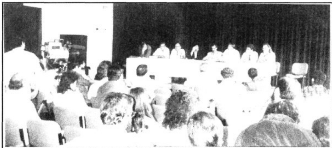
Acto de clausura en el Casal Pere Quart de Sabadell

Lo congresistas fueron invitados a visitar el "Centre d'Estudis i Recursos Culturals de la Diputació de Barcelona", las televisiones