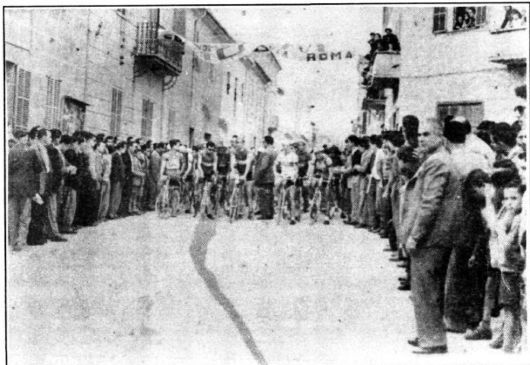
Carrera ciclista en Lloseta, año 1947