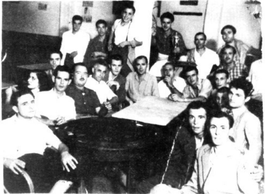
Algunos jugadores y junta directiva del Llosetense por aquellas fechas.

En la misma entrevista se ponía de manifiesto que el equipo debería reforzarse con nuevos elementos. En cuanto al terreno de juego: "Primero se tendría que vallar el campo, reformar todas las casetas y hacer un