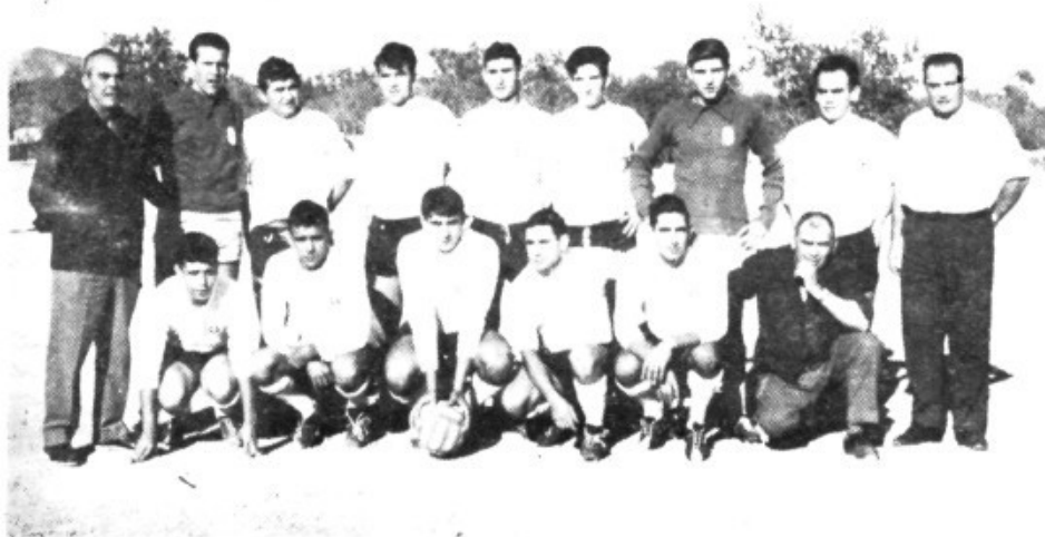
El C.D. Llosetense de principios de los 60

Antonio Santandreu Ripoll Fotos: Archivo A.S.R.