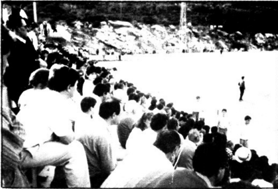
El Campo Municipal, escenario del ascenso del Llosetense

El próximo sábado, día 16, esta programado el cierre de esta brillante temporada que ha realizado el Llosetense. Por la tarde, a las cinco, partido telonero de veteranos entre el