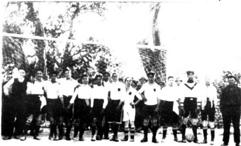
Primer equipo de fútbol del "F.C. Lloseta".

Con los 64 años de historia que lleva el fútbol en Lloseta este ha pasado por las más variadas situaciones tanto de euforia como de crisis. No pretendemos reseñar toda esta época pero si señalar algunos detalles significativos como son los tres nombres que ha tenido el equipo más representativo de nuestra