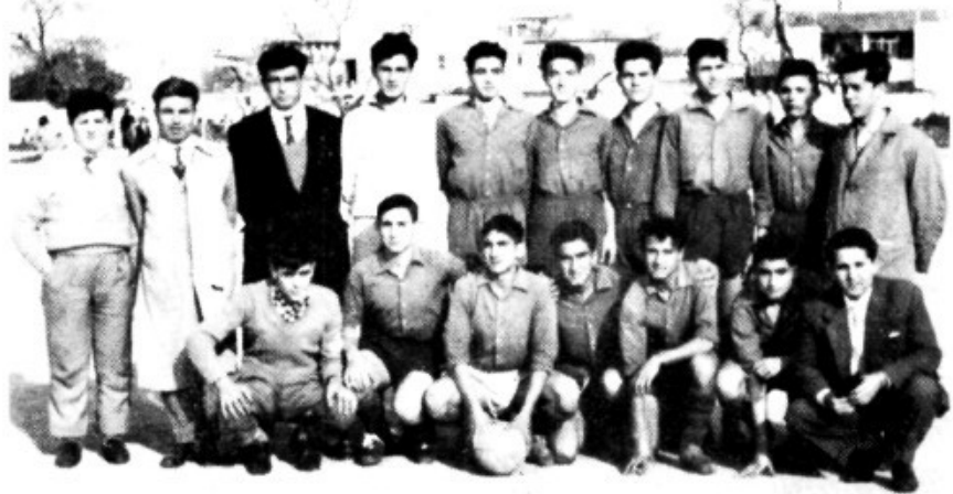
El F.C. Rápido

Queremos pensar, como de hecho el transcurso del tiempo lo ha demostrado, que los éxitos y el bien hacer de este equipo juvenil Rápido, tras conseguir numerosos éxitos siendo el principal el respeto en que era tenido y su buena preparación física y técnica, que representó una nueva singladura del fútbol en Lloseta puesto que se reorganizó desde su base. Ya no fue necesario en el transcurso de temporadas siguientes el concurso de jugadores foráneos (lo máximo tres o cuatro para reforzar alguna línea concreta), la cantera que habia formado el F.C.Rápido fue suficiente para que durante