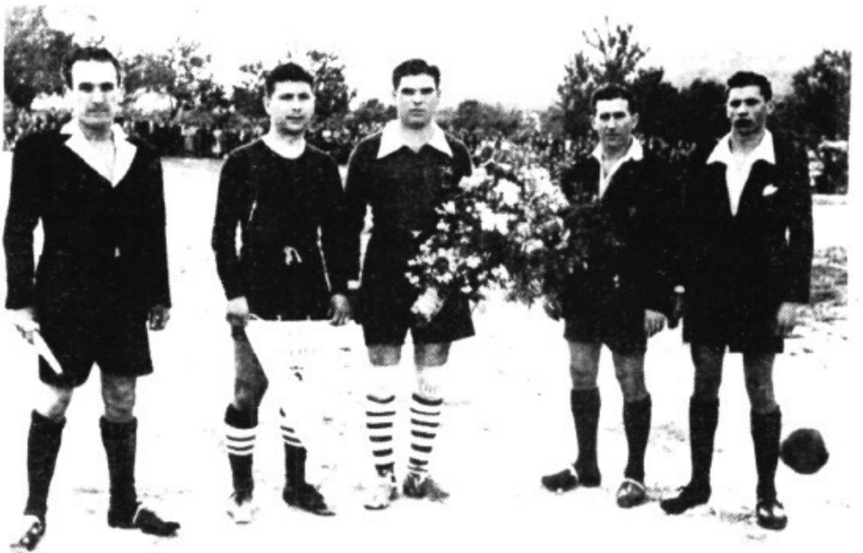
4-5-1952. Campo de "Son Batle". Antes de empezar el encuentro Llosetense-Menorca. Los capitanes del Menorca y del Llosetense y trio arbitral.

"Ciudadela" rumbo a Menorca pero, debido al mal tiempo, tuvo que suspenderse su salida. La Federación acordó aplazar el partido para el 11 de mayo y celebrar el primero en Lloseta el 4 del mismo mes.