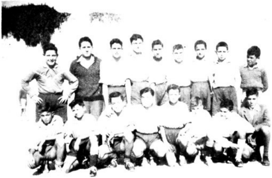
El C.D. Tarsicios

Sin embargo, el hueco que dejara temporalmente el C.D. Llosetense, fue cubierto con creces por un avasallador equipo juvenil, el F.C. Rápido. Este equipo tenía su principal virtud en el conjunto en sí, ya que no en vano sus componentes venían jugando juntos desde su creación como infantiles. Aunque ya es conocido, digamos que el F.C. Rápido de sus mejores momentos, se componía de una selección de jugadores de este mismo equipo y de otro infantil de nuestra población, C.D.Tarsicios, equipo que habia nacido en el seno del aspirantado de A.C. de Lloseta, y que tuvo una vida muy corta pero que, sin embargo, cumplió su cometido en el fomento del fútbol base, sacrificando su nombre en aras de una mejor formación e integrandose plenamente en el F.C.Rápido, tanto jugadores como técnicos y directivos.