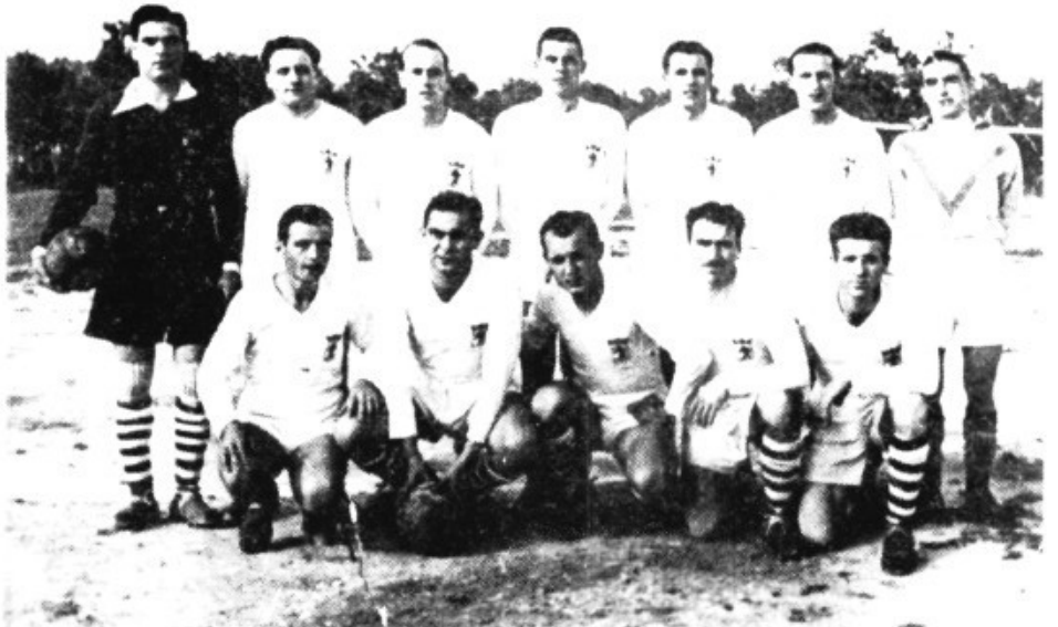
Campo de fútbol de "Son Batle", 4-5-1952. Equipo del Llosetense que consiguió el título de Campeón de Baleares.

El sábado, 26 de abril, a las 2 de la tarde, los jugadores del Llosetense, junto con su entrenador y varios directivos debían embarcar con la motonave