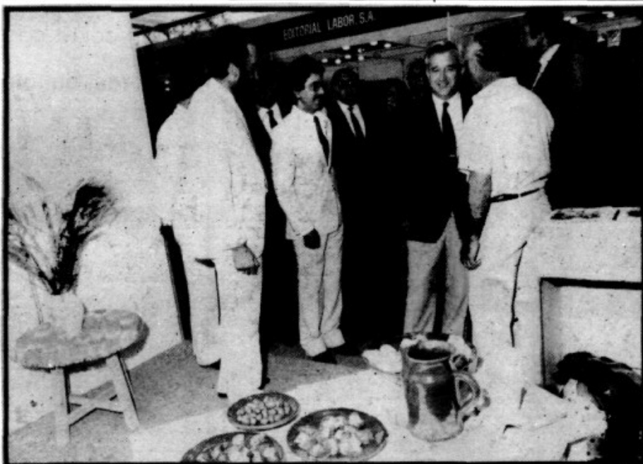
Moment en que el President Cañellas visita el Stand de Premsa Forana.