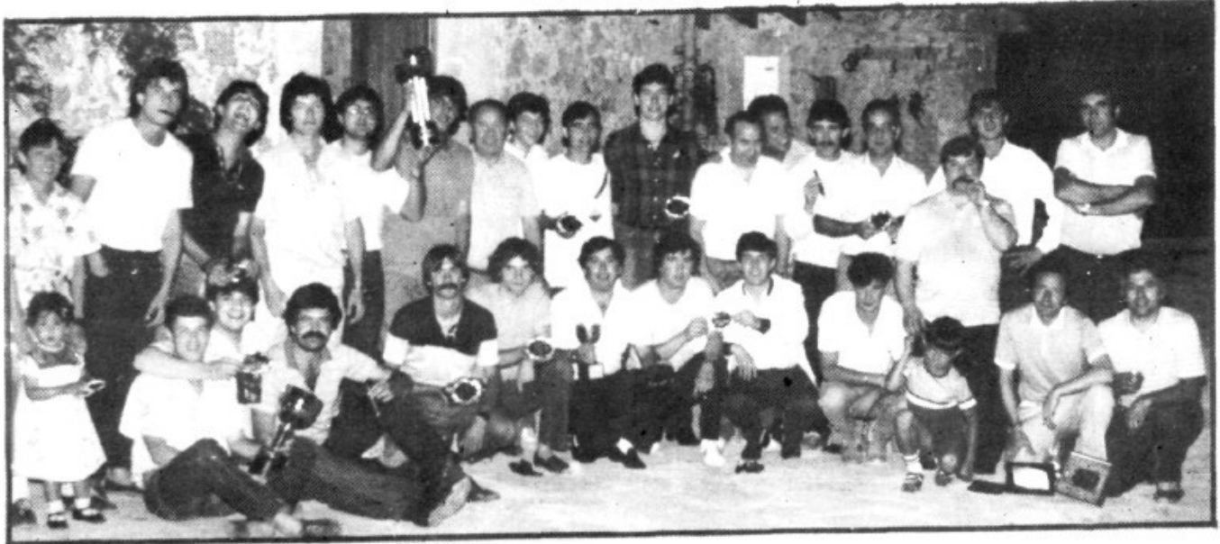
La plantilla total de jugadores después de la cena