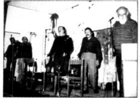
de la tarde.