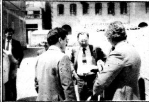
El Conseller de Sanidad

Es un servicio más a disposición del ciudadano.