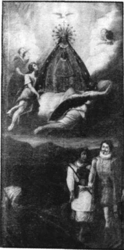
Siau nostra Protectora Verge i Mare de Lloseta.

Quan un temps, jo de petit, dalts del cambril sempre us veia de mirar, els ulls me treia viu, ben viu mon esperit; i el cor estret batejava amb un bategar ben fort a dins Vós, un gran conhort Mare bella jo esperava; i despert us somniava, encare avui m'en record!