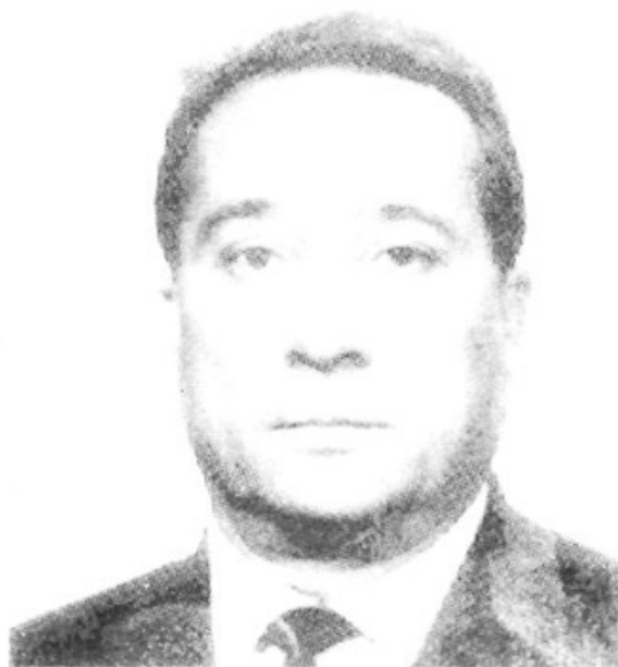
JAUME ARMENGOL COLL

Candidat a la Presidència de la Comunitat Autònoma