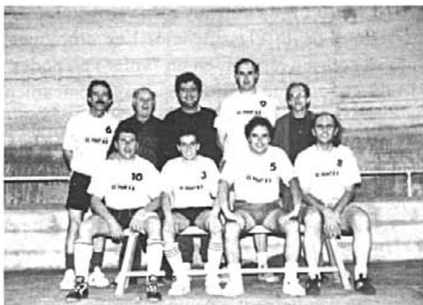
Equip de futbol sala d'Es Pont