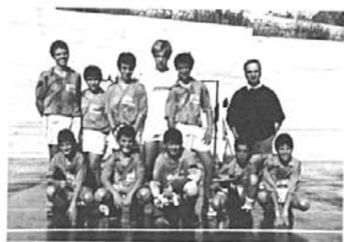
Equip infantil de futbol sala.

S'ha de dir que els Benjamins és el darrer any que poden participar en aquesta categoria ja que la propera temporada hauran de jugar dins la categoria Aleví