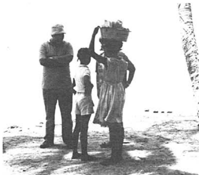
Ha valgut la pena idò?