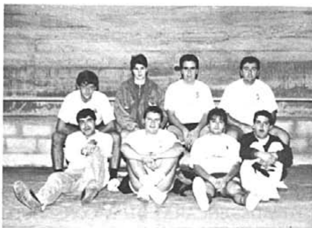
Equip de futbol sala de Ses Cotxeries