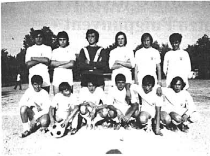
"El C.D. Puigpunyent en els seus millors temps".