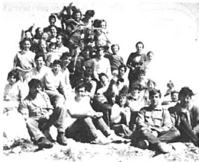
Aquesta és una de les primeres pujades al Puig de Galatzó.

d'organitzar i fer que es concentrin i preocupar-nos que qualcú sàpiga es camí, ja és suficient. No hi hem d'anar forçosament.