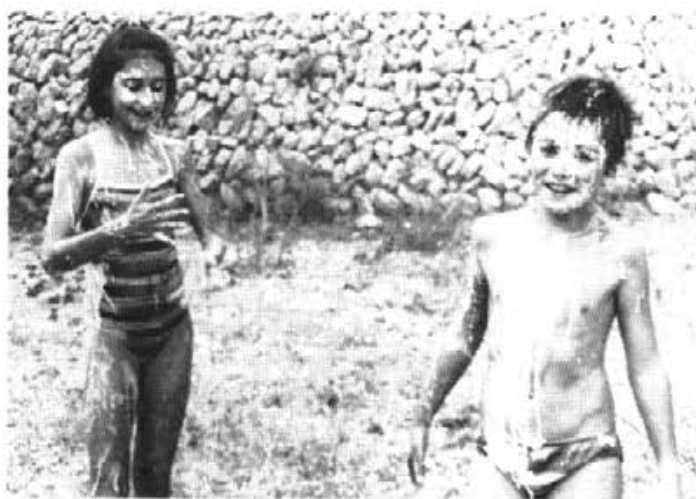
Els germans Morey quedaren «enmerdats» d'ous i farina a una improvisada batalla campal entre els grups participants.