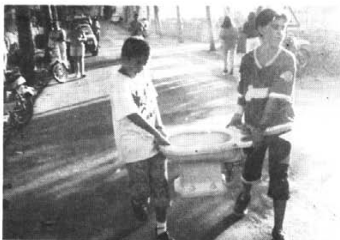
Aquests dos joves fóren capassos de portar un bidet al control.