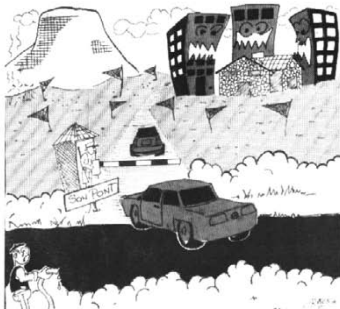
SON PONT, ¿així com serà al Setembre de 1991?

Aquest mes no surt la secció habitual de SES TIMBES perquè els seus redactors han tingut que sortir de viatge per motius de feina. Així i tot, vos demanam disculpes.