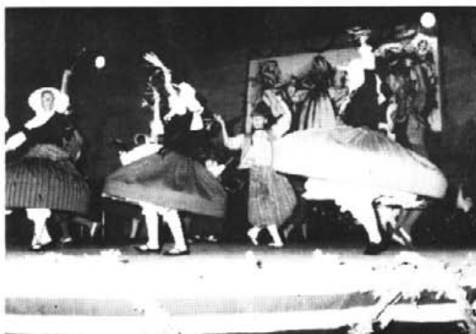
La bulla i l'alegria fou una clara mostra dels balls.