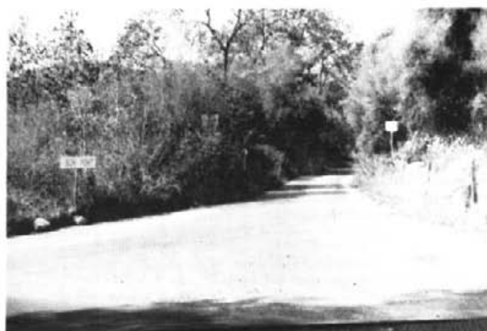
SON PONT, així com és al Setembre de 1990.

En canvi, l'execució d'aquest projecte representaria un conjunt important d'inconvenients per al poble i suposaria una sensible disminució de la qualitat de vida dels qui hi vivim. S'ha de tenir en compte que el consum d'aigua necessari per regar un camp de golf de 18 forats és l'equivalent al consum d'una població d'uns 8.000 habitants, és a dir, unes 12 vegades el que consumeix el nucli de Puigpunyent. Un consum abusiu que en poc temps faria davallar els nivells dels pous i eixugaria els aqüífers de la nostra vall, de manera que tendríem ben aviat problemes d'aigua potable a les nostres cases. Ni