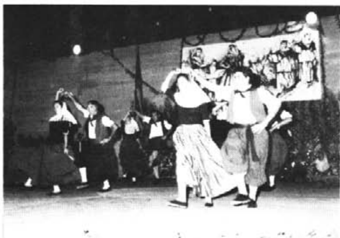
Flors des Salt donà bona mostra de la seva actuació