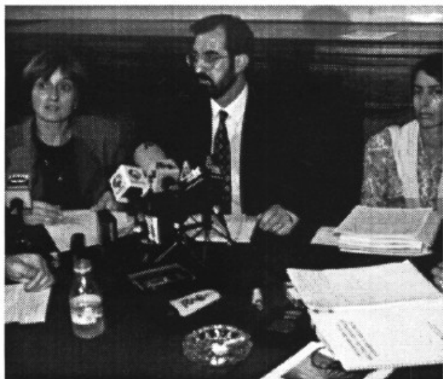
Moment de la signatura del conveni per a la millora de l'explotació agrària a Mallorca

El Consell Insular de Mallorca i la Unió de Pagesos han signat un conveni per a la millora de l'explotació agrària a través del centre europeu d'informació i animació rural