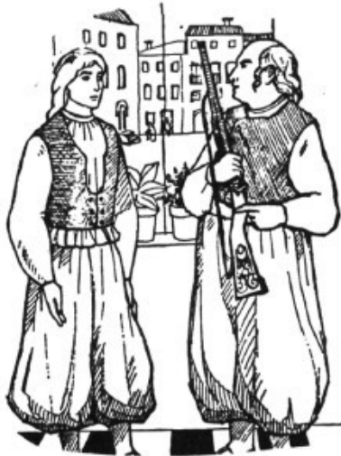
3- Bregues entre veïnats o per assumptes de foravila.

Els assumptes tractats a la cort són molt diversos, i constitueixen una font d'informació preciosa per al coneixement de la societat mallorquina de l'època; des de promeses de matrimoni incomplides, qüestions referents a herències, fins a deutes, robatoris, tals fetes pel bestiar, agressions o robatoris a mà armada.