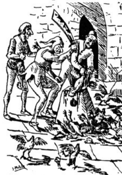
6-Robatoris i bandejats.