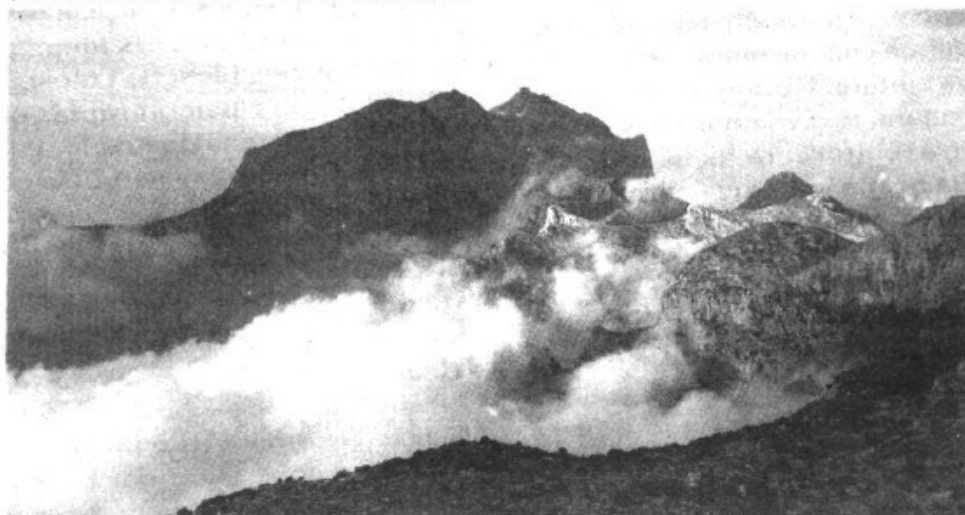
El Puig Major, des de la Serra d'Alfàbia. [JJ]

L'excursionisme massiu i poc respectuós causa també un impacte greu en la Serra: