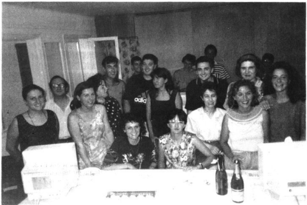
Alumnes del curs d'informàtica

A la revista EL TEMPS ha sortit, dins de l'apartat dedicat a la gastronomia, una ressenya del restaurant de Ses Tarragones. En aquesta ressenya es fa referència a la gent que duu el restaurant, al fet que allí s'hi celebren les Trobades per a la Independència i a la bona teca que diuen que no està gens malament. El plat que es dóna de referència és "Burballes amb conill". Si no sabeu com ho fan a Ses Tarragones ja ho podeu saber copiant la recepta que surt a la revista. Que vos faci bon profit!