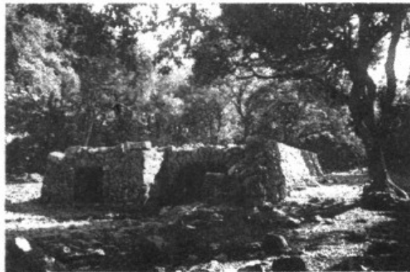
Els Aljubets de Planícia. [JJ]