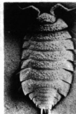
Balearonethes sesrodesanus , crustaci endèmic d'una cova de Pollença. [HD]

ins, fent una utilització més que discutible de les ajudes de la CEE per a regions econòmicament deprimides; noves esteses d'alta tenció; noves pedreres en projecte; far previst a la Punta Beca; etc.