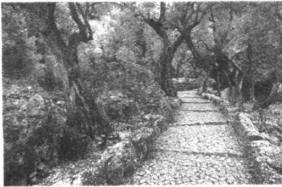
Camí empedrat. [JG]