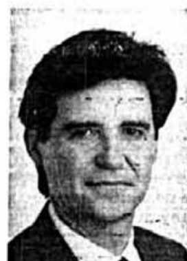
Joan Mir (Amagal) Cap de llista al Senat

LA CANDIDATURA QUE TENDRÀ A MADRID DIPUTATS INDEPENDENTISTES