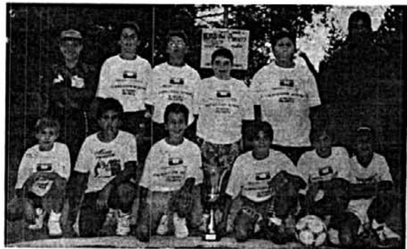
L'equip infantil APA Col·legi St. Alfons, campió del Trofeu «Sant Agustí 92»