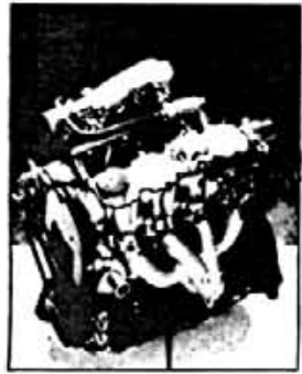
Nueva serie de motores Astra de Inyección. Multipunto, con más potencia por cm 3

Imaginate, tu Concesionario Opel te invita a sentir la potencia del nuevo Opel Astra.