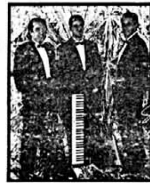
BAILE DURANTE TODA LA NOCHE CON EL CONJUNTO "LLEVANT"