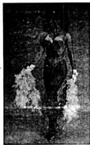
SHOW DE LA SUPERVEDETTE "BRENDA PALACIN"