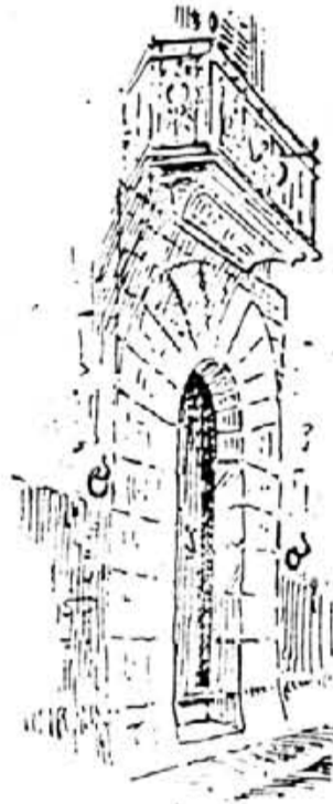
Can Rabassa del carrer Major

La tècnica emprada en la construcció d'aquestes cases era el marès per als elements que integraven els arcs entre aiguavessos i pels que circuïen portals i finestres, així com per a les cadenes cantoneres, rafes i contraforts, que donaven solidesa als murs fets amb dues cares de paredat amb morter i reble de terra i pedruscall. A les construccions més bones s'empraven mitjans de marès de picar (de bona qualitat) pels elements exteriors, però a l'interior, on generalment es cobria amb referit, s'emprava el cantó de Sa Mola que, com sabem, ha esdevingut la ruïna de les nostres construccions. A les cases humils empraven indiscriminadament el cantó de Sa Mola tant per l'exterior com per l'interior. I pel que fa als acabats de façanes, predominava el referit de morter, però també s'usava el paredat verd a la vista i el morter allisat amb incisions o esgrafiats.