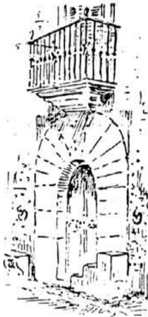
Can Prohens de Sa Font

Com exemple més arcaic, ens cal fer referència d'una construcció que sortosament, bé que transformada, i amagada rere una façana moderna ha arribat fins a nosaltres. S'ubica al carrer de Nuno Sanç número 15 (Ca'n Bordoy), i no és precisament un estatge d'estil popular, sinó el que fou solar del senyor Onofre Ferrandell, batle de Felanitx durant la Germania, qui morí precisament en aquest domicili en mans dels agermanats. Hem de situar la data d'aquesta construcció no més tard de finals del XV o primers anys del XVI, de manera que és la construcció diguem-li noble, més antiga que ens ha arribat. L'amplària del solar —possiblement més gran encara originàriament—, la colòssal altura dels sòtils i l'estructura del celler revelen amb escreix el seu origen.