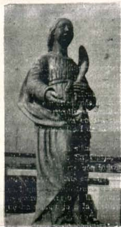
La imatge tal com quedà després de la restauració de Jaume Mir.

nam enèrgicament aquest atemptat al nostre patrimoni artístic, perpetrat sens dubte per persones que no mereixen la consideració de concitadans.