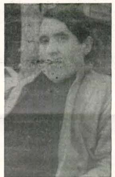
Barcelona» 1986 («Carrer Marsala»).

Recordem que Miquel Bauçà obtingué el premi «Joan Salvat Papasseit» 1961 («Una bella història»), el «Vicent Andrés Estellés» 1971 («Notes i comentaris») i el «Ciutat de