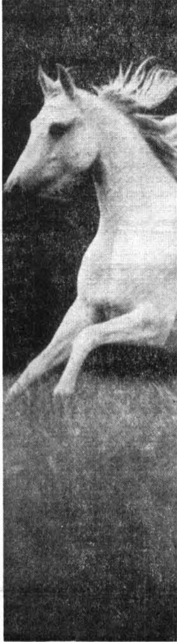
EJEMPLAR NACIDO EN MALLORCA