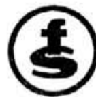
Foto S I R E R IMAGEN y SONIDO C. Mayor, 28 - Tel. 580309 FELANITX

CALCULADORAS WALMANS PRISMATICOS RADIO-CASSETTES