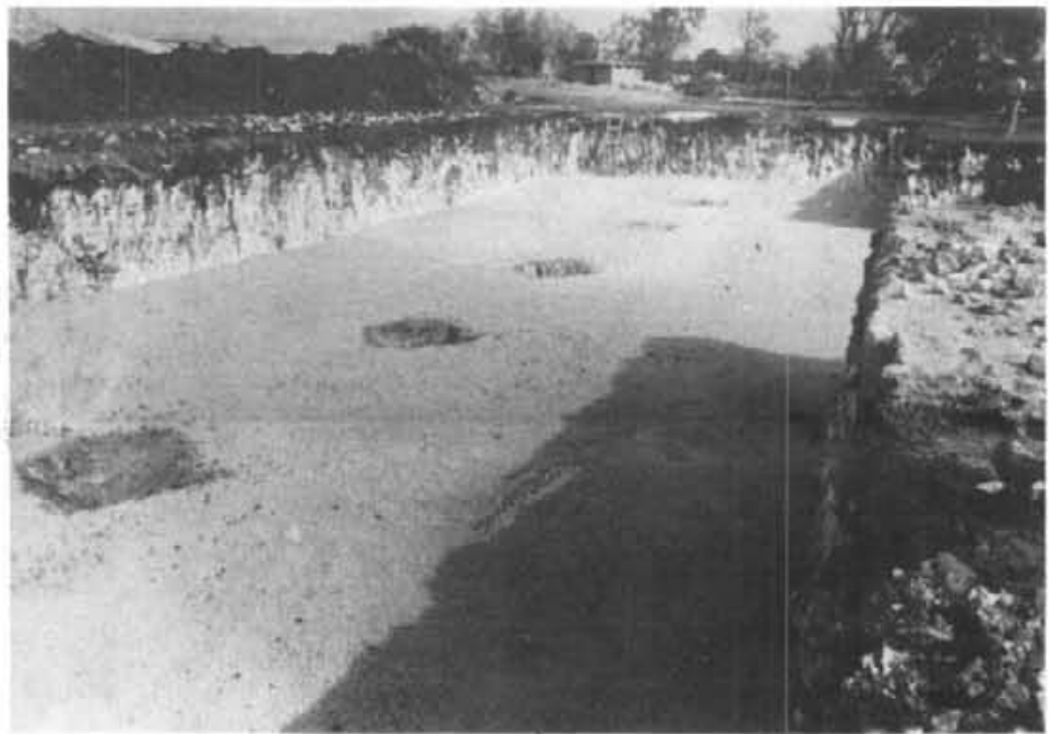
Estan ben avançades les obres fetes a So'n Mesquida arran de la concentració parcel·laria. Vetaci un aspecte de l'excavació per al dipòsit distribuïdor d'aigua que ha d'alimentar les instal·lacions de reguiu que tant beneficiaran una extensió molt considerable del nostre terme.