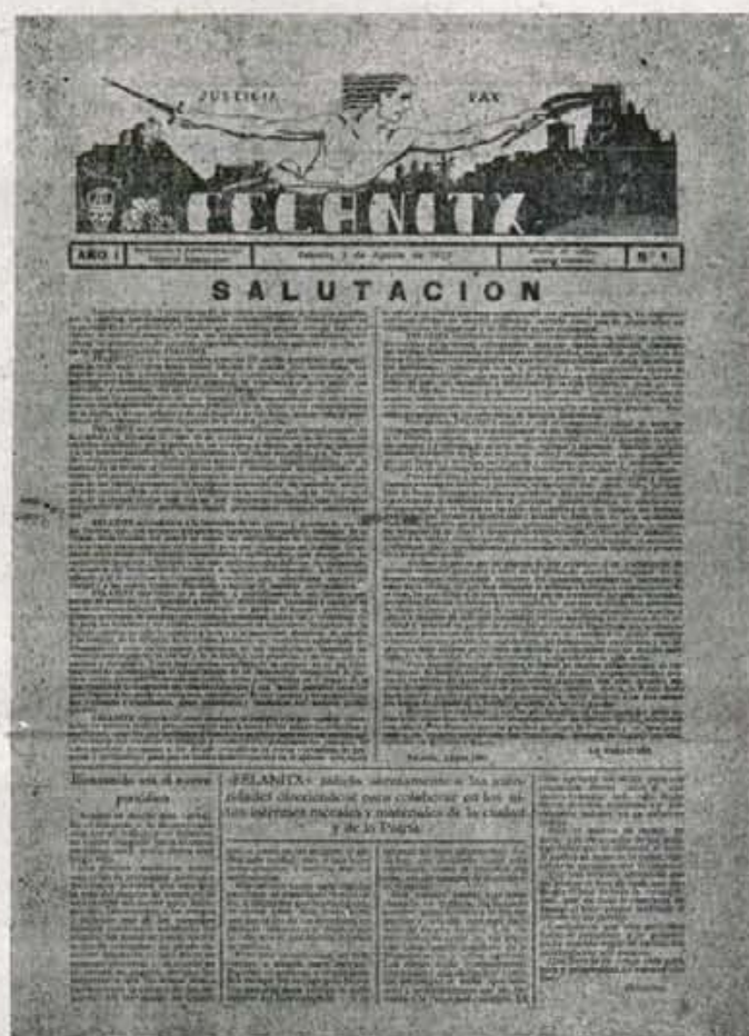
Portada del N.º 1 de «FELANITX»