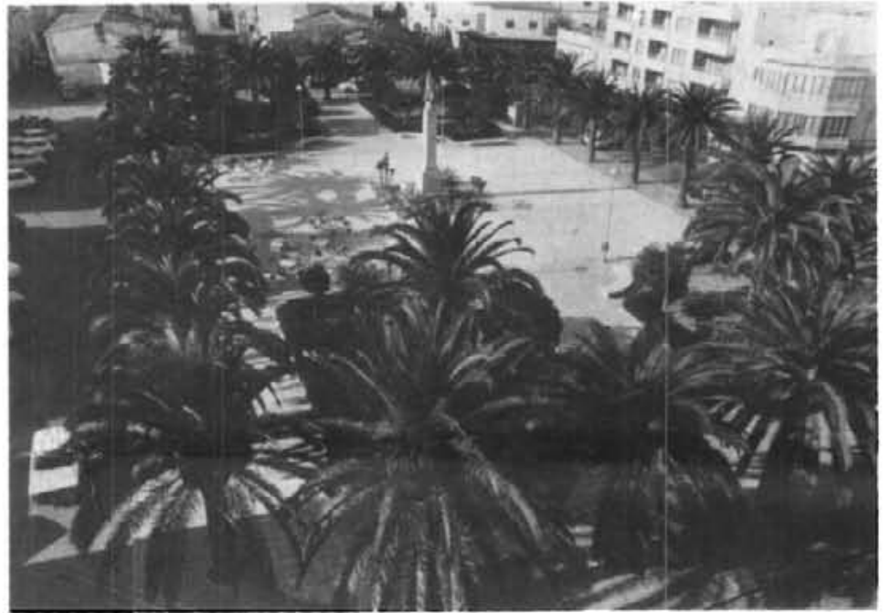
Vista de la plaça d'Espanya amb el nou enrajolat de que fou objecte aquest estiu passat.