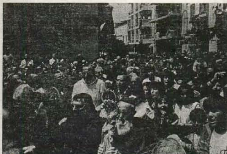
Enmig de l'entusiasme de la multitud, la imatge de la Mare de Déu arriba al peu de l'escallera parroquial.