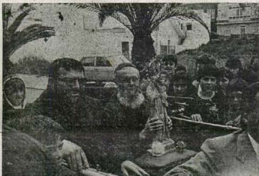
La imatge de la Verge, en cotxe descobert, des de la Via Argentina, es aclamada en el trajecte fins a la plaça de Sa Font.