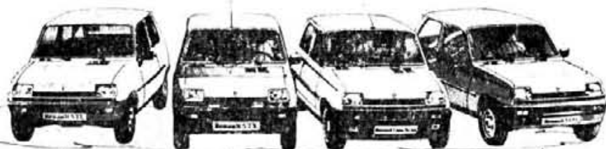
RENAULT 5 TL

En los Concesionarios RENAULT encontrarás tu SUPER 5.