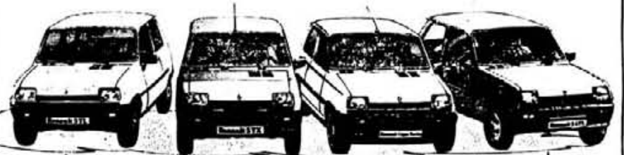
RENAULT 5 TL

En los Concesionarios RENAULT encontrarás tu SUPER 5.