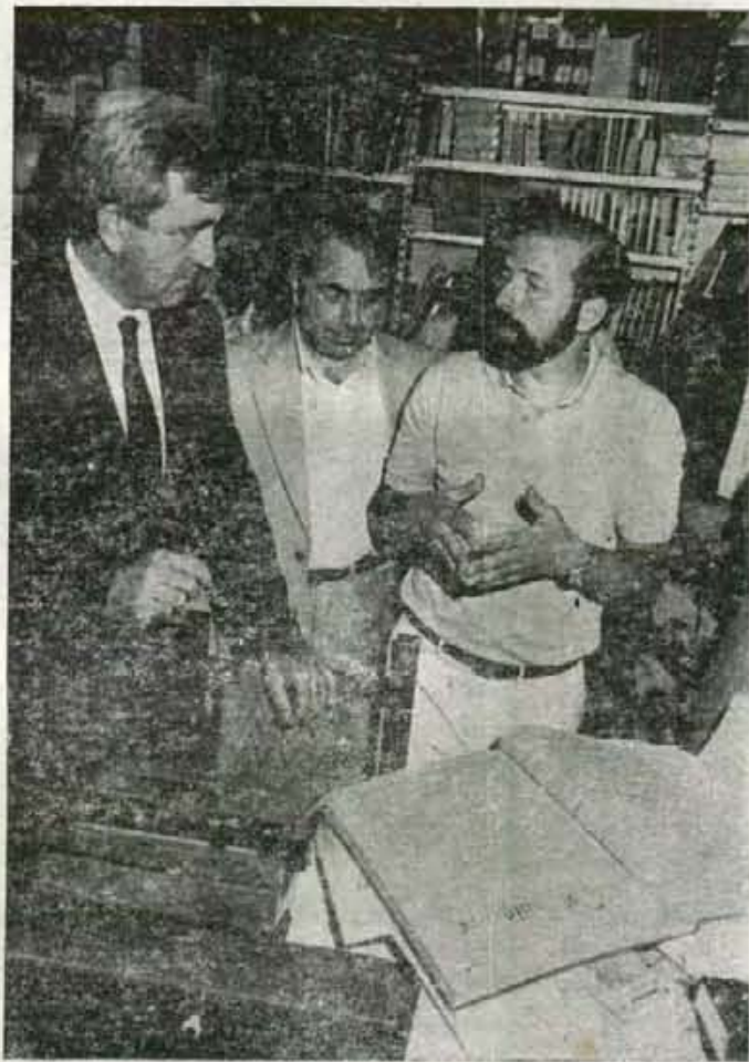
El President visita la nostra Redacció