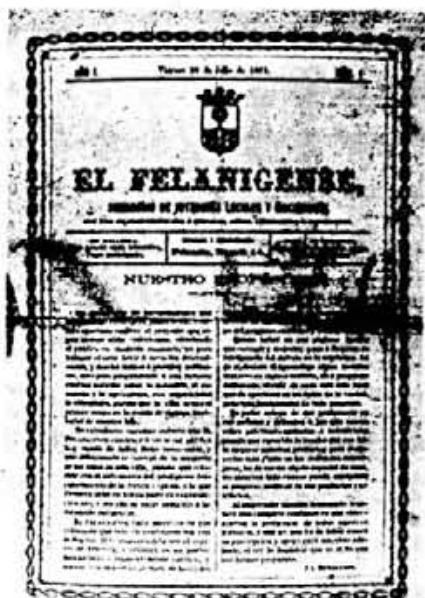
Portada del primer número de «El Felanigense».

A Felanitx, el setmanari degué esser molt ben rebut, perquè a la Sección Local del número 13 apareix una nota que diu textualment: Desseando corresponder a los continuos favores que el público ha dispensado a nuestro humilde semanario, hemos resuelto darle mayores dimensiones al empezar el segundo trimestre o sea desde el número próximo . Efectivament, el número 14, conservant les quatre pàgines, adopta el format de 39 x 28 cms, més usual a la premsa de l'època.