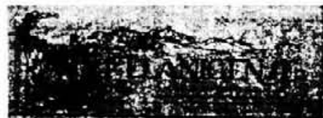
Capçalera de «El Felanigense» a la dècada de 1920.