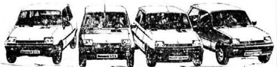
RENAULT 5 TL