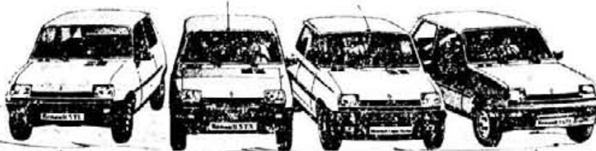
RENAULT 5 TL