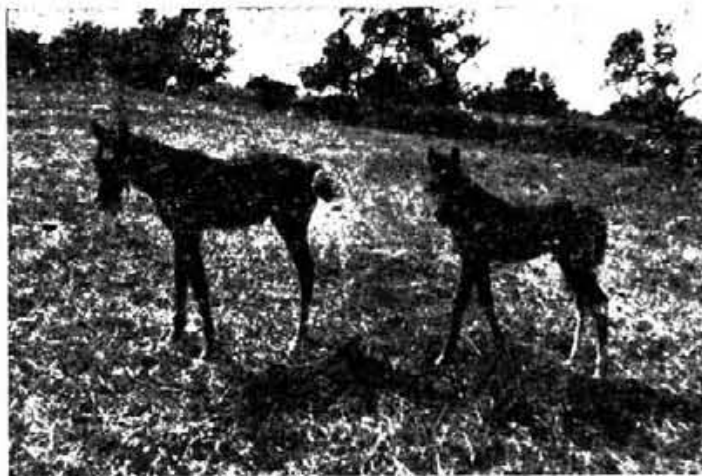
Dos potros árabes. Obsérvese su diminuta cabeza, una de las características de raza pura