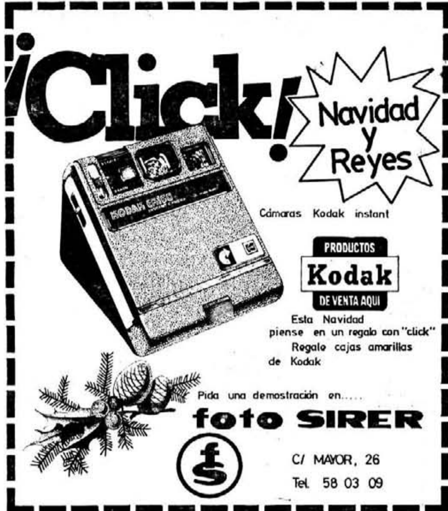
FOTO SIRER les desea felices Fiestas