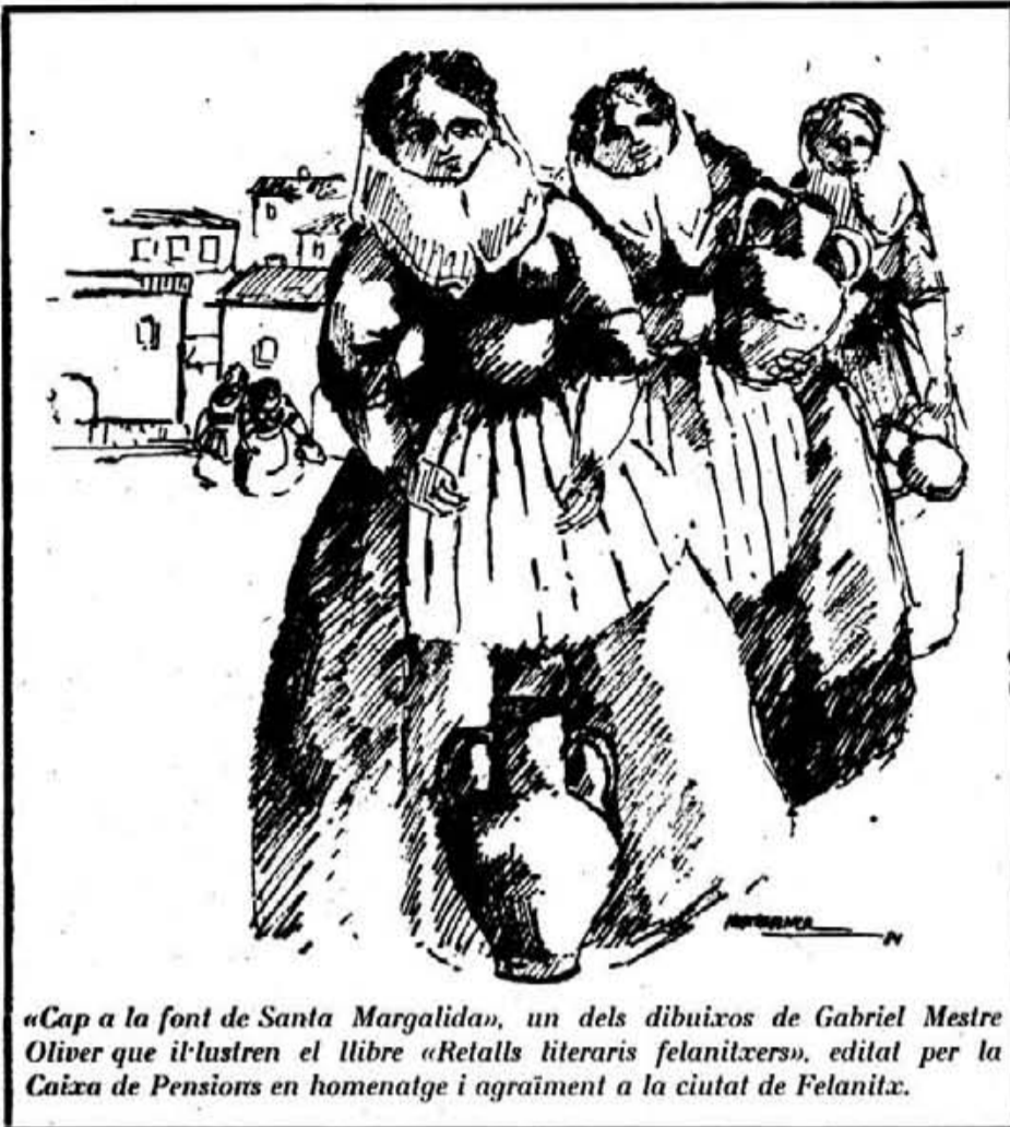
«Cap a la font de Santa Margalida», un dels dibuixos de Gabriel Mestre Oliver que il·lustren el llibre «Retalls literaris felanitxers», editat per la Caixa de Pensions en homenatge i agraïment a la ciutat de Felanitx.