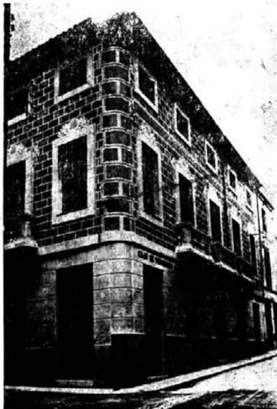
L'edifici de LA CAIXA, abans de la reforma de 1962

bé hi va haver un canvi d'emplaçament de l'entrada, passà de la cantonada Prohisos al carrer de la Mar.