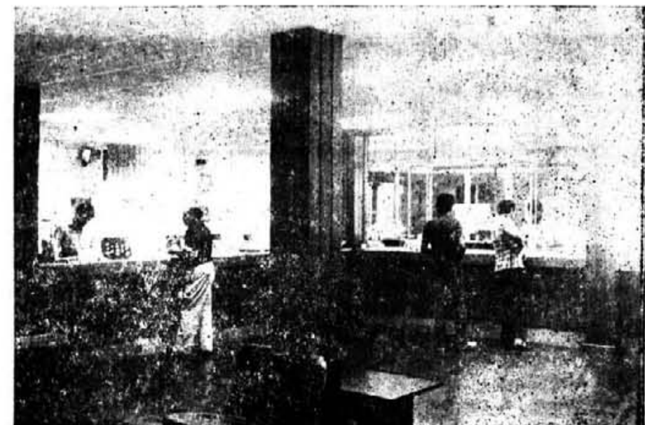
Les oficines a l'actualitat