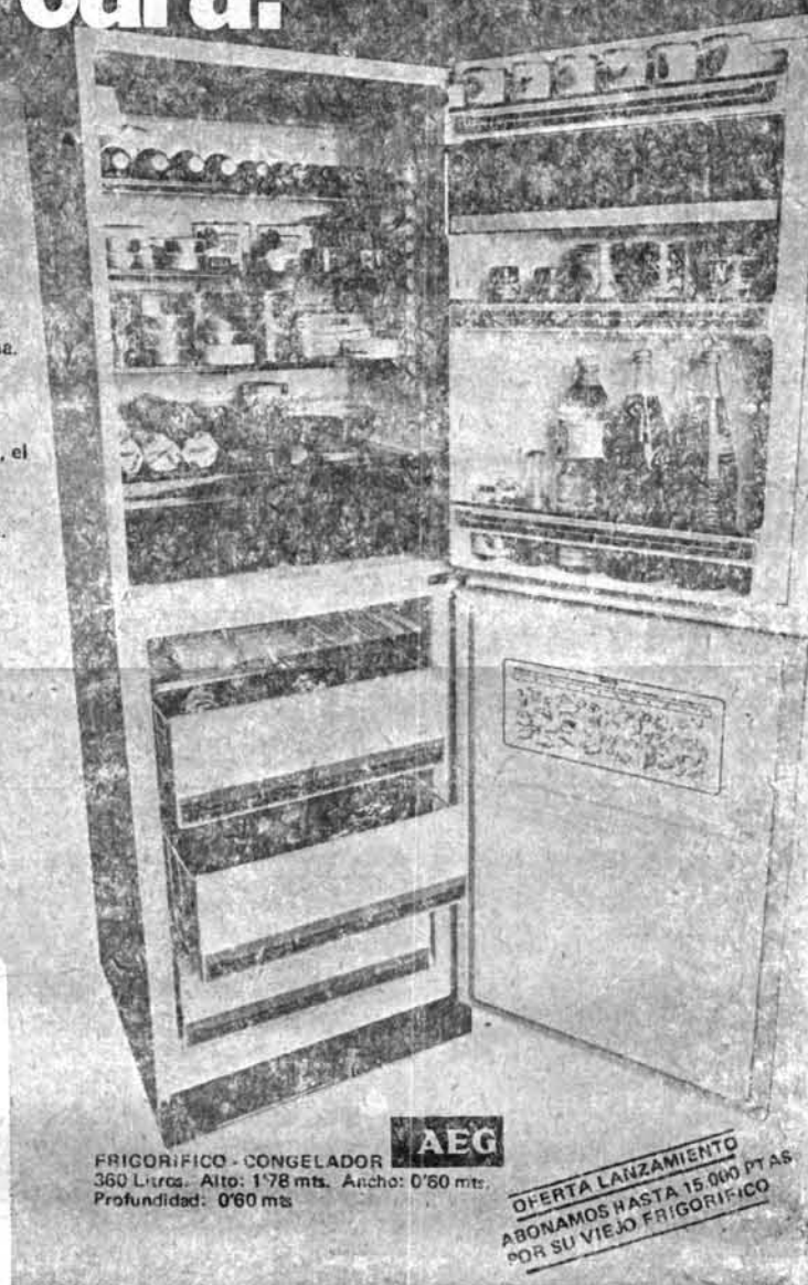
FRIGORIFICO-CONGELADOR AEG 360 Litros. Alto: 1'78 mts. Ancho: 0'80 mts. Profundidad: 0'60 mts.

OFERTA LANZAMIENTO ABONAMOS HASTA 15.000 PTAS POR SU VIEJO FRIGORIFICO