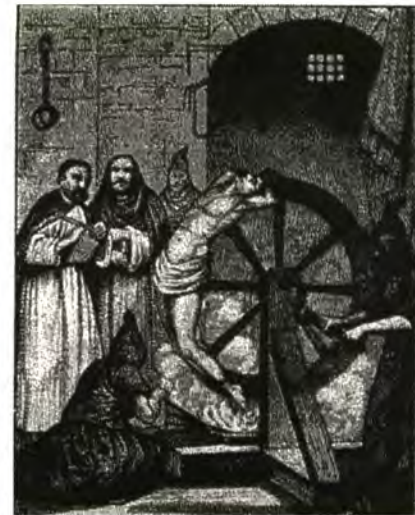
La Inquisició, principal arma omnimoda del cesaropapisme espanyol.

Butlla "Libet ab inicio": La Inquisició és implantada a tota l'Església Catòlica. Restabliment de la Inquisició al Vaticà.