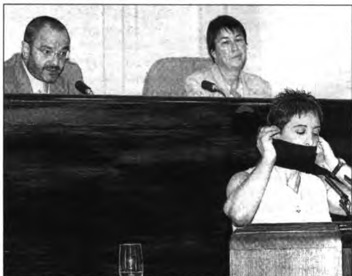
Una parlamentària navarresa de EH és mordassà en la Camera en protesta per la il·legalització

En plantejar la qüestió al Parlament basc, emperò, s'han trobat que, per raons totalment diferents, s'ha produït una aliança entre el PP, el PSOE i Batasuna. Batasuna, en aquest afer, ha estat el grup que ha actuat (tant si actuava com a grup com si ho feien com a suma de diputats individuals, no sigui que en Garzón s'emprenyi) amb més coherència. Consideren, coherentment amb el seu inde-