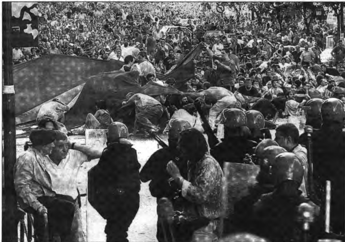
Greus incidents després de l'atac de la policia basca sa la gernació congregada.

Quadrilles d'ertzaines embossats fins a les dents netejaven de gent a pilotades els carrers Fernández del Campo i General Con-