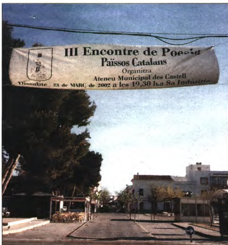
L'Ajuntament des Castell saludava amb pancartes enmig del carrer el III Encontre de Poesia dels Països Catalans.

he tengut una llarga conversa amb el poeta de les Illes que més premis a guanyat de poesia i narrati-