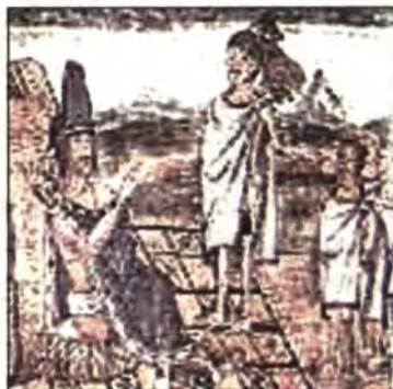
MOTECUHZOMA II XOCOYOTZIN, novè sobirà de Tenochtitlan

4-1521: Comença el setge de Cortés a Tenochtitlan (actual ciutat de Mèxic).