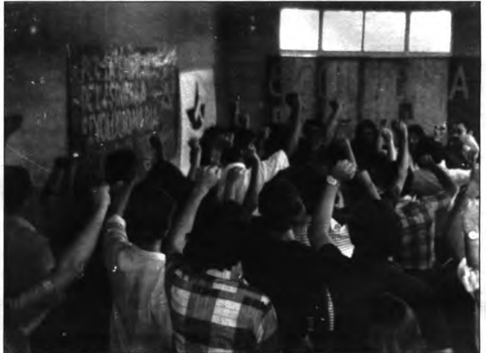
Finals dels anys setanta: reunió clandestina de l'OEC a Clutat.