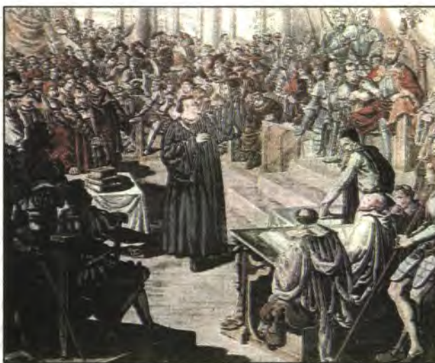
Luter davant del Kaiser a la dieta de Worms.

16 a 26-4-1521: En Luter es presenta davant el Kaiser a la Dieta. Eck l'hi ataca de nou. No atenyen de fer-lo retractar dels llibres que ha escrit (al·legat luterà per la llibertat de consciència: «no és segur ni just d'actuar contra la consciència. Déu m'ajudi. Amèn»). El Kaiser Karl manarà cremar els escrits de Luter.