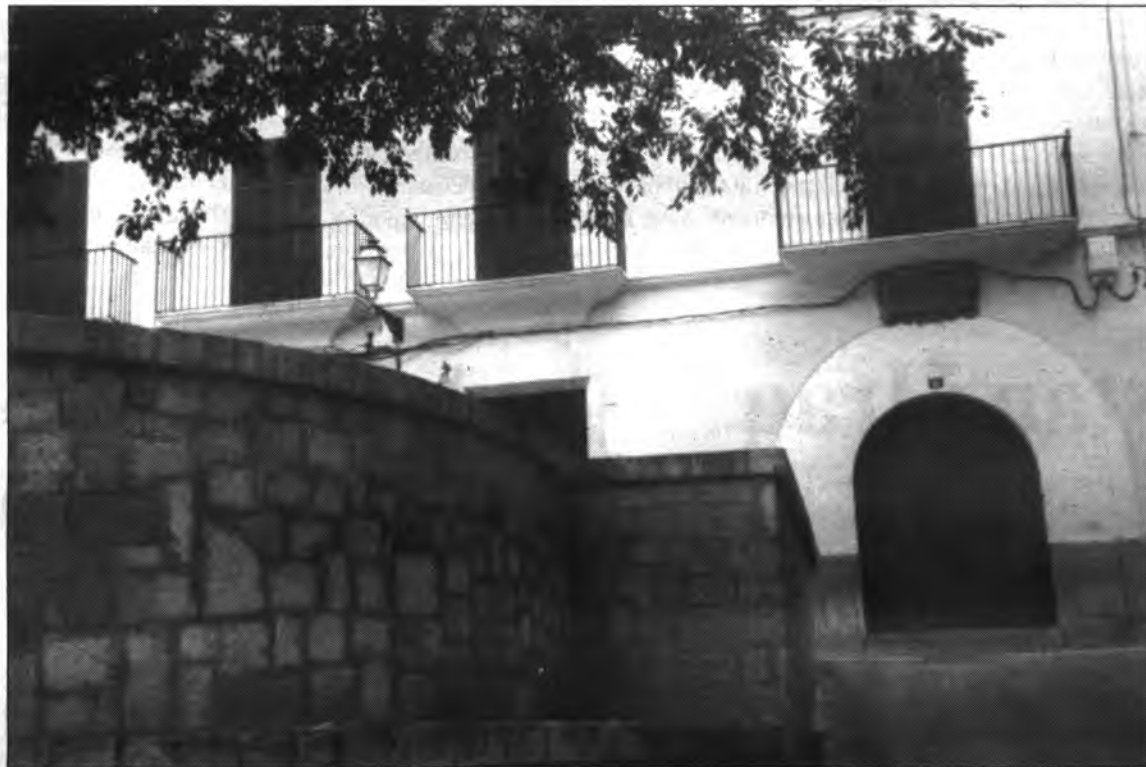
Plaça de Tagamanent.

En resum i com es pot veure, una placeta plena d'història. ☺