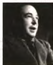
CLIVE STAPLES LEWIS.

“Déu ens xiuxiueja en els nostres plaers, ens parla a la nostra consciència, però ens crida en els nostres patiments: es tracta de la seva megafonia per a despertar un món sord”. (Clive Staples Lewis, 1898-1963, autor cristià britànic a El problema del patiment).