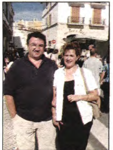
Són l'amo i la madona de la Pensió can Guixa de Manacor que anaren a la Fira de Felanitx. Tel. 971 553 69