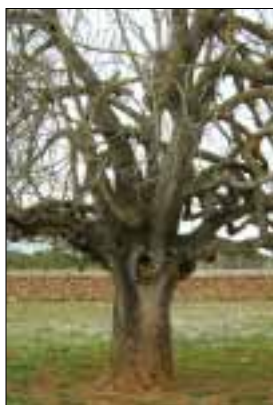
PORTADA Fotografia de Montserrat Pons i Boscana

Què hi podem fer? Poca cosa. Mentre tenguem una Constitució (amb majúscula) que ens obliga a conèixer l’espanyol i ens permet, si volem, saber altres llengües; mentre no sigui necessari conèixer el català, el nostre català, per comunicar-nos i per guanyar-nos la vida, tenim clarament, transparentment marcat el camí cap on anam.