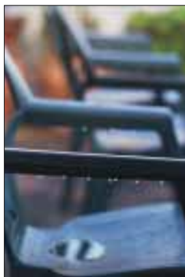
PORTADA Rosada

Enguany celebrem l'any del llibre, de la gastronomia, de la física i de mitja dotzena de coses més. Per celebrar-los hem pensat de pujar al campanar, agafar un llibre, evidentment de cuina, tirar-lo avall i calcular l'acceleració de la caiguda; així haurem complit amb les tres efemèrides. Bé, fora bromes, formalment, com que de física no en sabem un borrall i de gastronomia millor no parlar-ne perquè el metge ens ha privat de tot el que ens agrada, procurem fer honor al llibre i a la lectura: llegiu qualche llibre, i si pot ser triau-los que valguin la pena.