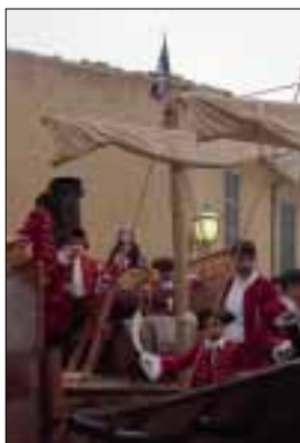
PORTADA Rua d'Algaïda 2005 Reis de la mar

En fi, que no seria de més que la quaresma significàs per a nosaltres qualche privació i qualche dejuni, encara que no fos més que pensant en la nostra salut, fins i tot deixant de banda consideracions religioses. I que l'equinocci de primavera –que enguany pràcticament enllaça amb la Pasqua Florida- sigui senzillament això: l'arribada del bon temps, l'esclat de verdor i ufanor dels camps i el vaticini d'una bona anyada.