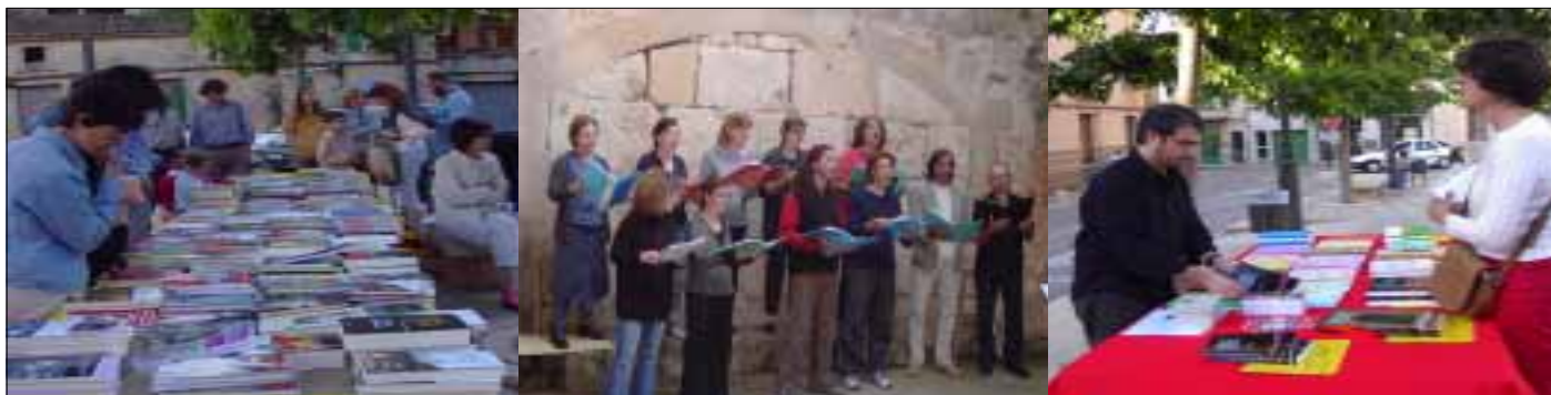
PORTADA Festa del llibre. Diumenge 23 de maig de 2004

Si no és avui serà demà que la república vendrà.