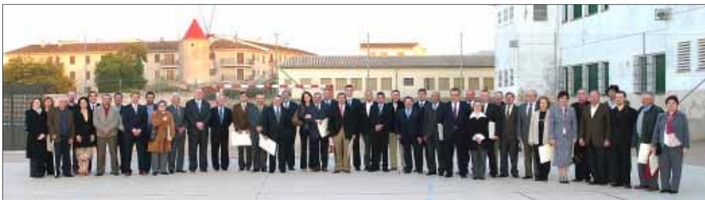
PORTADA 25 anys d'ajuntaments democràtics

A nivell local, convé recordar l'homenatge a batles i regidors d'aquests vint-i-cinc anys de democràcia, un acte ple de records per a molta gent.