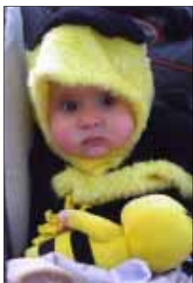
PORTADA Rua d'Algaida 2004

En definitiva, és aconsellable anar a votar i fer-ho conscientment, prudentment i de manera raonada. Després no queda sinó acceptar el veredict de les urnes, agradi o no; i si no hem fet ús del nostre dret de vot no tendrem cap argument per queixar-nos del resultat o per lamentar-lo.