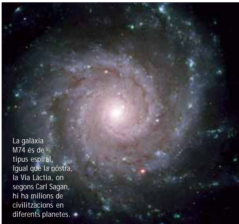
La galàxia M74 és de tipus espiral, igual que la nostra, la Via Làctia, on segons Carl Sagan, hi ha milions de civilitzacions en diferents planetes.

Una de les causes d'aquesta dificultat o impossibilitat de supervivència d'una civilització tecnològica ha anat referida sem-