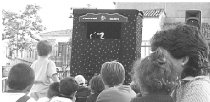
Representació de Pupurri , a càrrec de s'Estornell Teatre

Per animar la diada, el grup s'Estornell Teatre interpretà l'espectacle de titelles Pupurri .