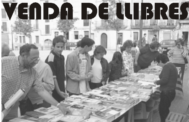
Paradeta de llibres en català de la Delegació d'Algaida de l'Obra Cultural Balear

Diumenge dia 26 va tenir lloc a Plaça la tradicional venda de llibres . Com ja és tradició, la Delegació d'Algaida de l'Obra Cultural Balear posà a disposició de tothom les darreres novetats editades en català i l'Ajuntament d'Algaida mostrà les publicacions que produeix.