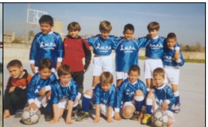
Escoleta de futbol. Col·legi P. Pou.