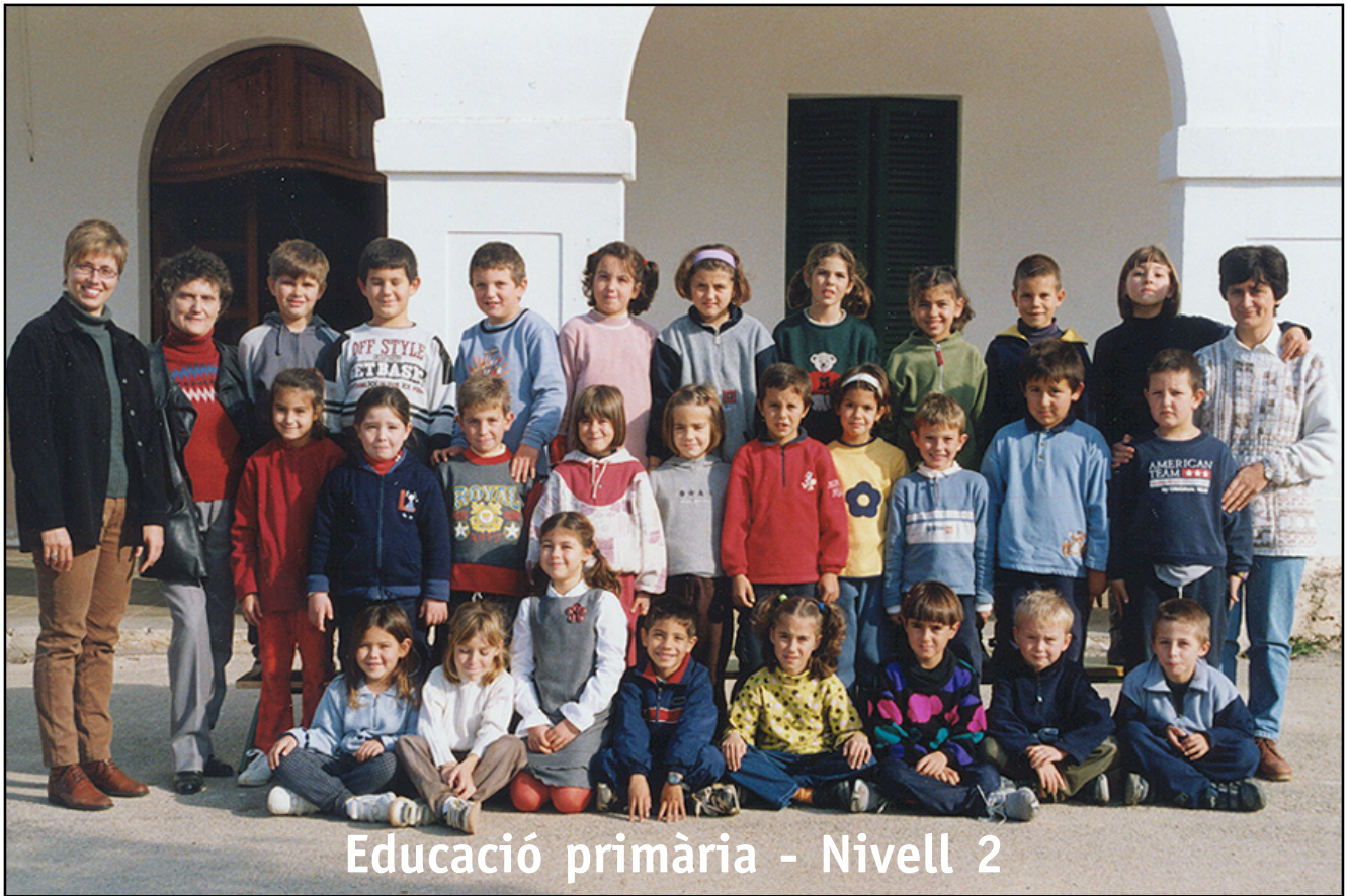
Educació primària - Nivell 2