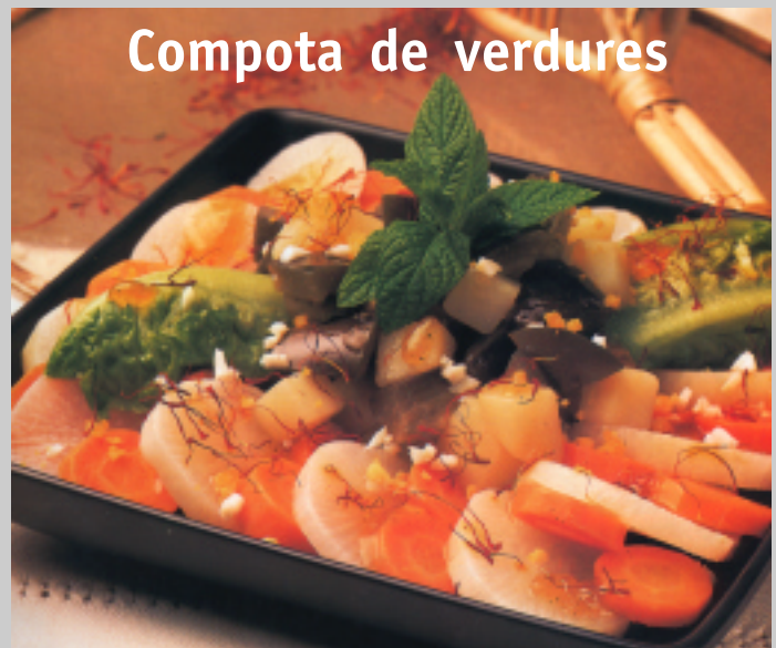
Compota de verdure