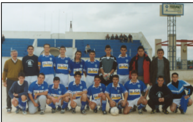
Equip de juvenils.