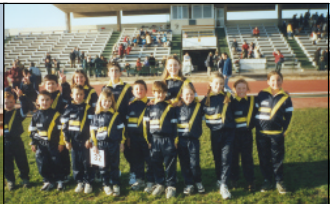
Grupet de nins d'Algaida que participaren a una competició de pista.