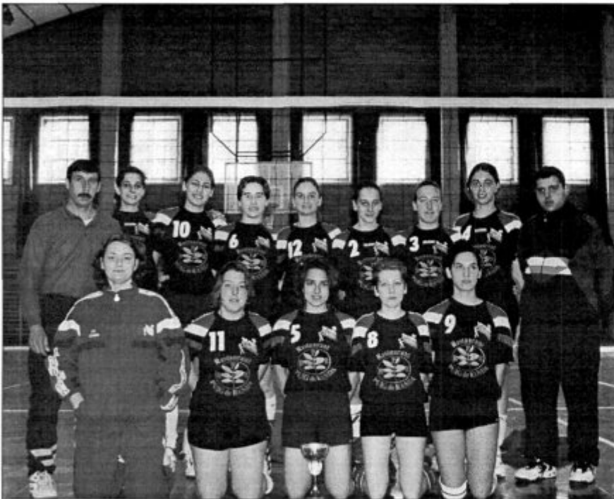
Equip juvenil femení, recent campió de Balears 97-98, que jugarà el sector de Campionat d'Espanya els dies 3, 4 i 5 d'abril a Terol (Aragó)

aconseguint èxits i li va desitjar sort en els campionats d'Espanya