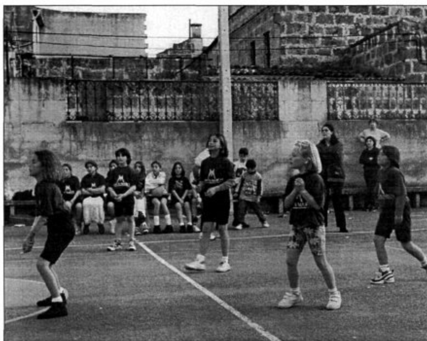
Equip benjamí del C.V. Algaida en el partit que va guanyar per 2-0 al Petra.