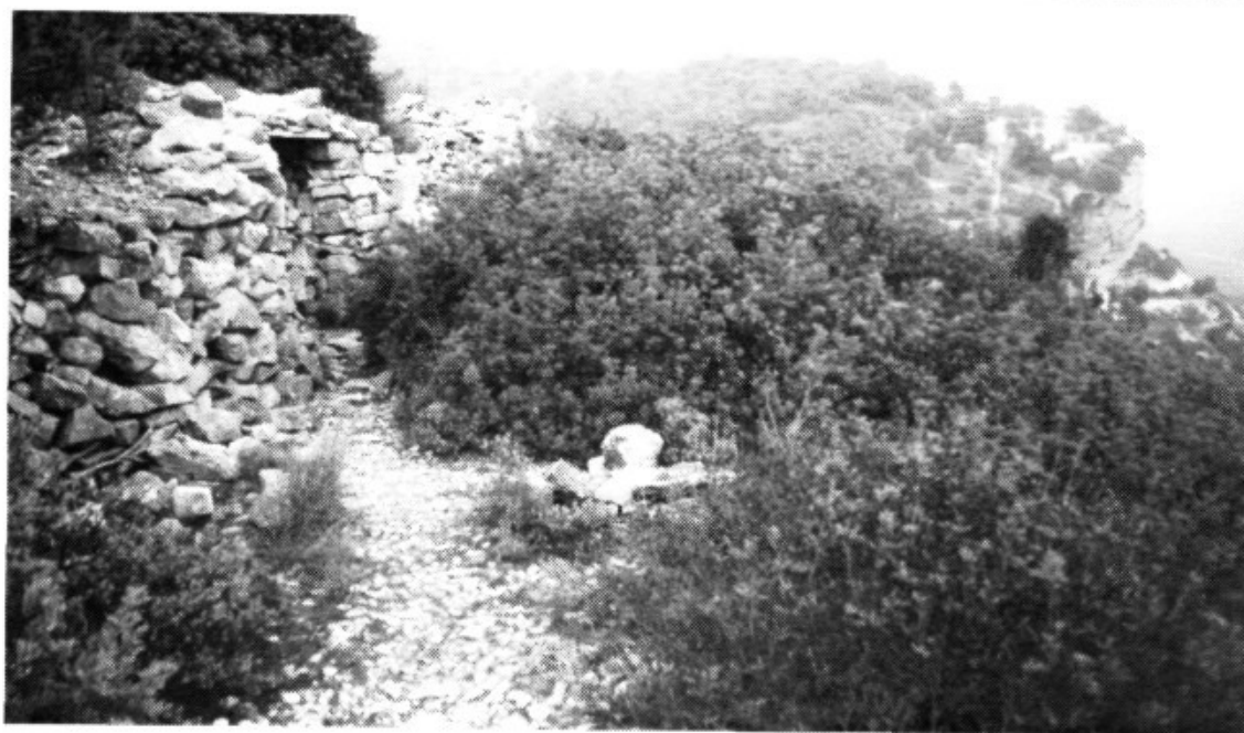
Des del cim del Puig de Son Reus, les pedreres d'Es Coconar són una talaia excel·lent dels santuaris de Sant Honorat i de Gràcia.

una roca bona, en podíem treure quatre o cinc en un dia. Però de vegades havíem d'escurar dies sencers, i no trobàvem res. Amb certesa puc dir que, quan els teníem aquí baix mig arrodonits, necessitàvem al voltant de tres dies per tenir-los enllestits definitivament.